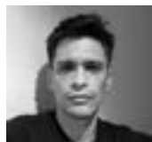
Matías Otálora DISEÑO DE VIDEO