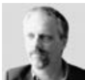
José Luis Fiorruccio ILUMINACIÓN