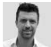
Ariel Casalis TENOR