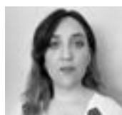
Florencia Burgardt SOPRANO