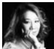
Eiko Senda SOPRANO