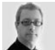
Diego Siliano ESCENOGRAFÍA