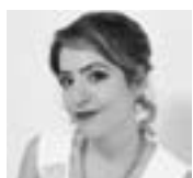
Florencia Machado MEZZOSOPRANO