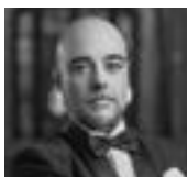
Fermín Prieto TENOR