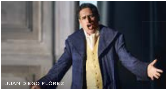
JUAN DIEGO FLÓREZ