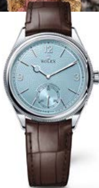
PERPETUAL 1908 EN PLATINO