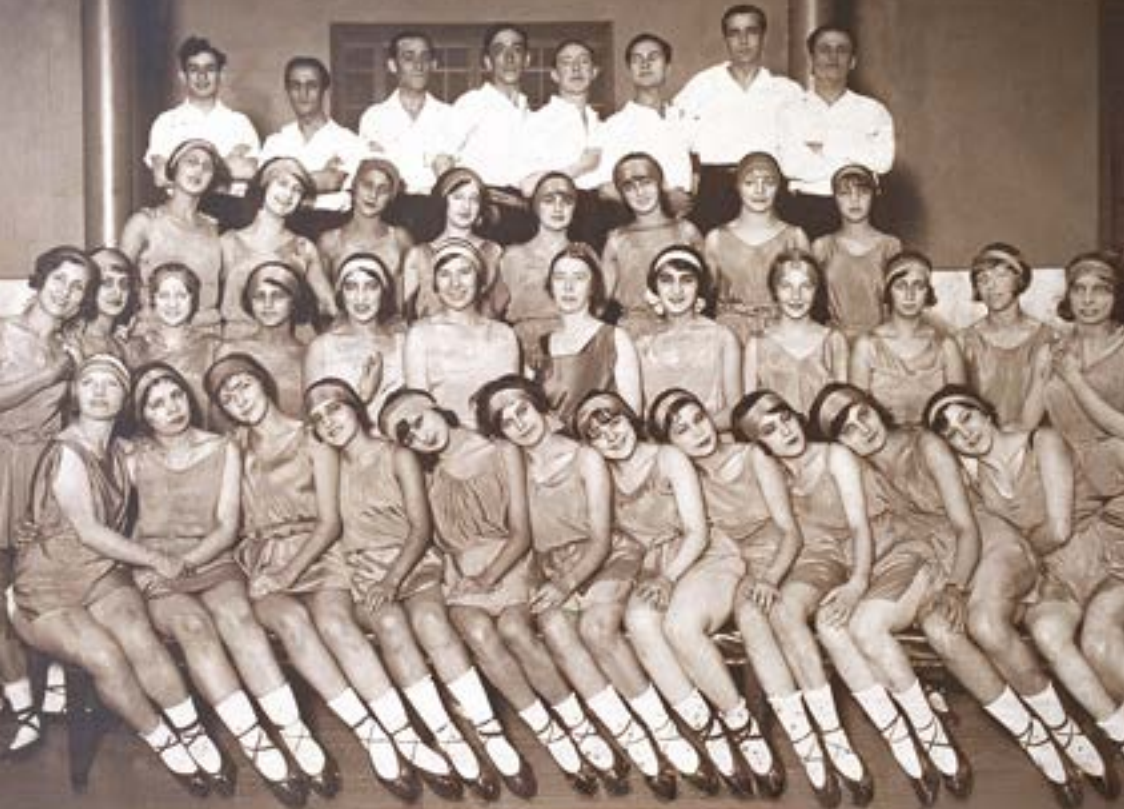
1. Ballet Estable del Teatro Colón. Año: 1925.