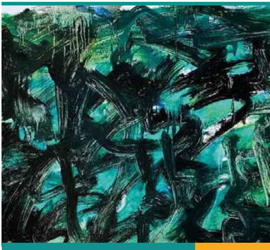
Alejandro Avakian - Green (2023) Colección Fundación Corporación América | Oficina CGC

Creemos en el poder de la expresión artística para inspirar, unir y transformar.